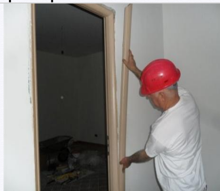
16. Incastrare le mostrine.