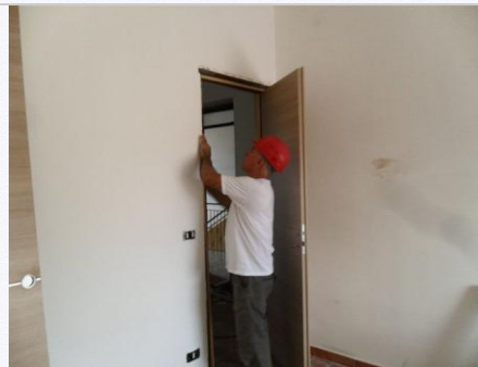
5. Inserire la porta nell'apertura.