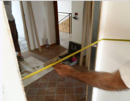
2. Controllare la misura interna del controtelaio