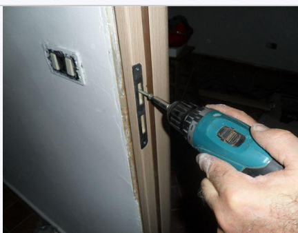
10. Consigliamo di inserire le viti dietro la contro piastra per evitare viti a vista, e per un montaggio più ordinato.