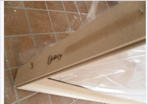
3. La chiave in dotazione si trova attaccata al telaio porta.