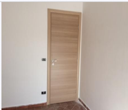
17. Avete completato il montaggio della porta .