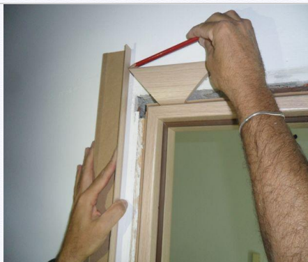
14. Tagliare i coprifili .