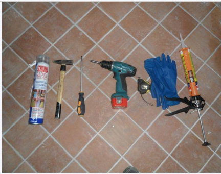
1. Strumenti per il montaggio