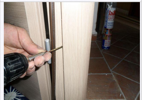
9. Consigliamo il fissaggio della porta al falso telaio inserendo le viti dietro la guarnizione per un montaggio più ordinato.