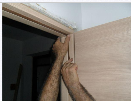
11. Inserire la guarnizione.