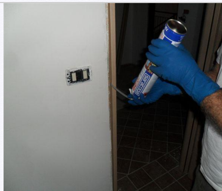
13. Riempire i vuoti attorno al telaio con la schiuma . Maneggiare con cura, poiché questa potrebbe fuoriuscire