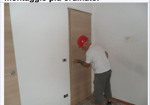
12. Testarne il corretto funzionamento .