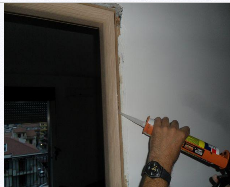
15. Mettere il silicone nell'incastro del coprifilo.