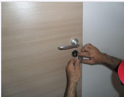
7. Montare la maniglia in dotazione