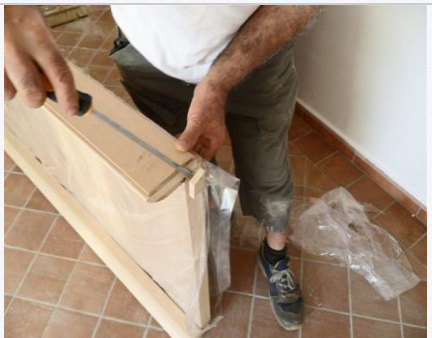
4. Rimuovere il tocchetto inferiore