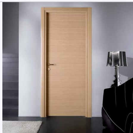
18. Modello porta a battente FIP